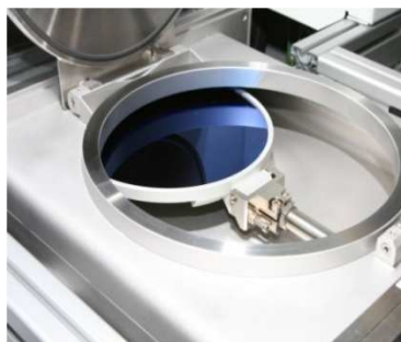
Bloque de carga manual